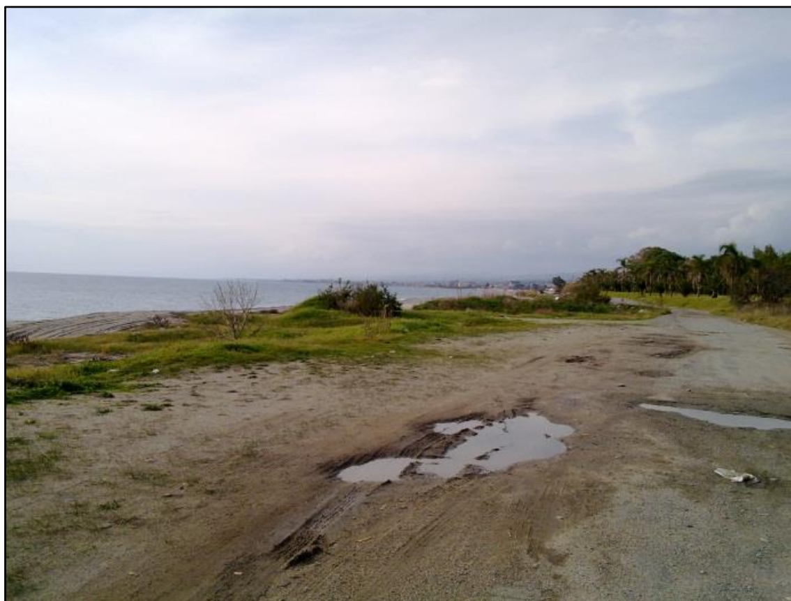
Figura 11: L'arenile a confine con Roccella Ionica