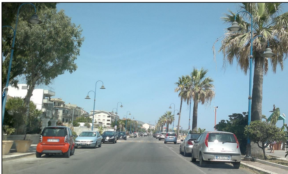
Figura 5: Veduta del lungomare C. Colombo