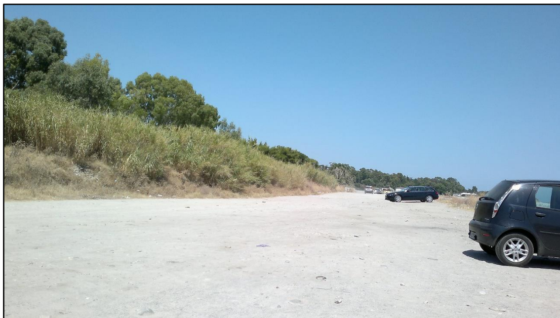
Figura 10: Viabilità dopo il ponte sulla fiumara Romanò