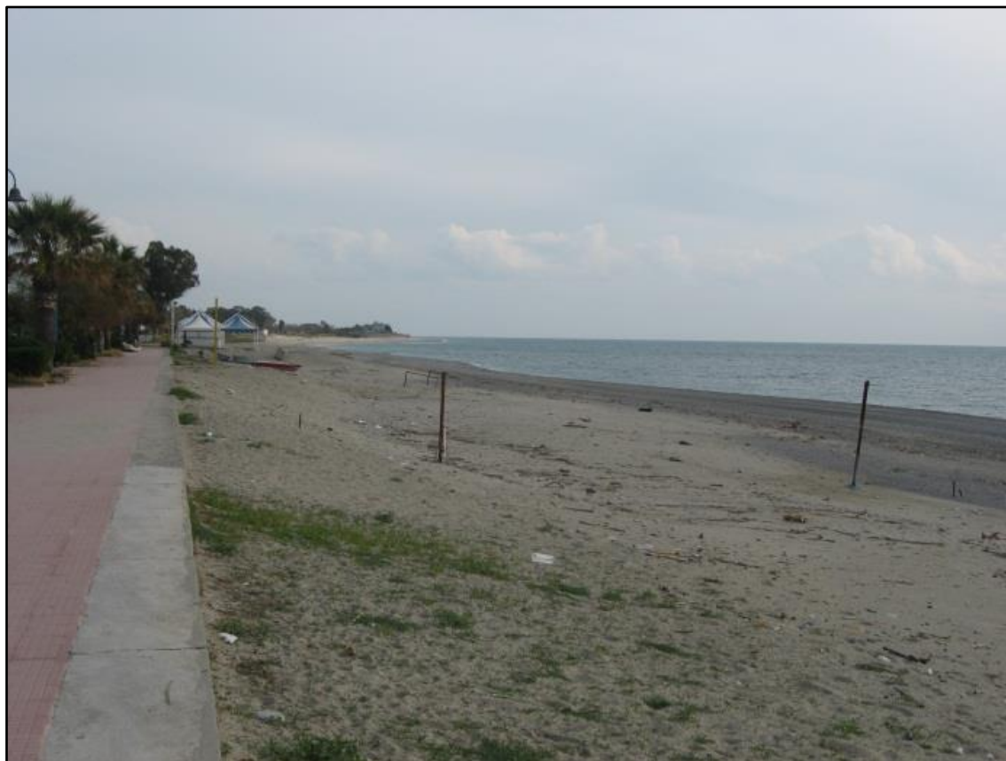
Figura 7: L'arenile a ridosso della ex SS106