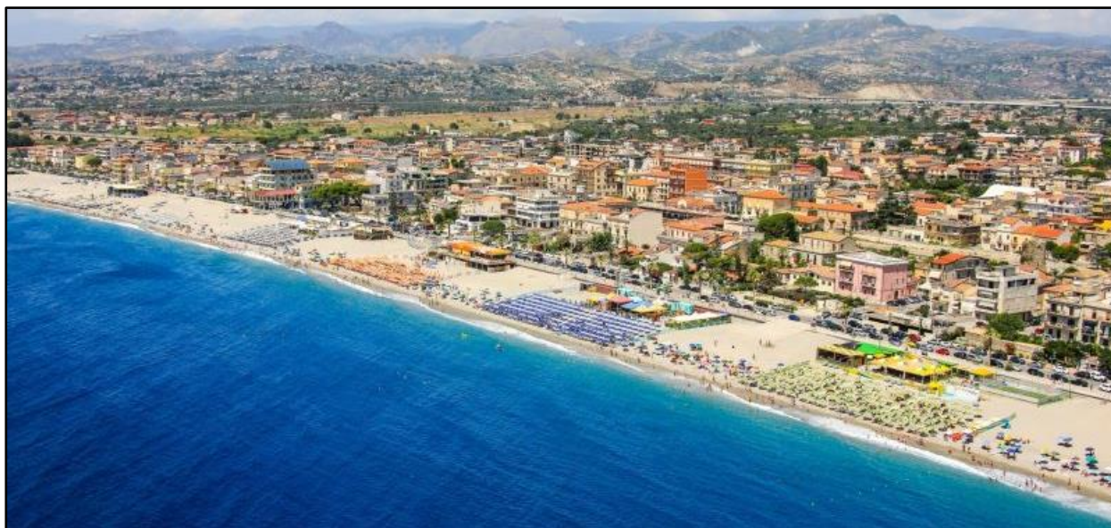
Figura 1: Veduta del litorale di Marina di Gioiosa Ionica

Esteso su una superficie pari a 15 kmq presenta un territorio prevalentemente collinare, segnato orograficamente dalla vallata del Torbido, con un'escursione altimetrica di 475 metri sul livello del mare; confina a nord con il Comune di Gioiosa Ionica, a ovest con il Comune di Grotteria ad a est con il Comune di Roccella Ionica.