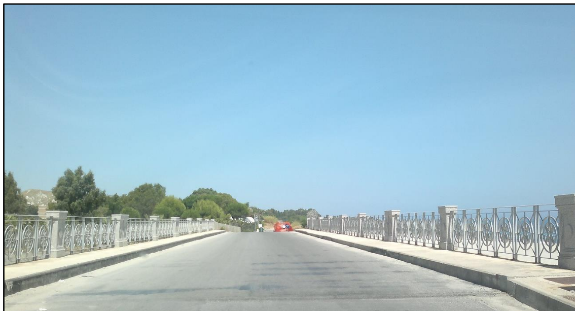
Figura 9: Ponte sulla fiumara Romanò