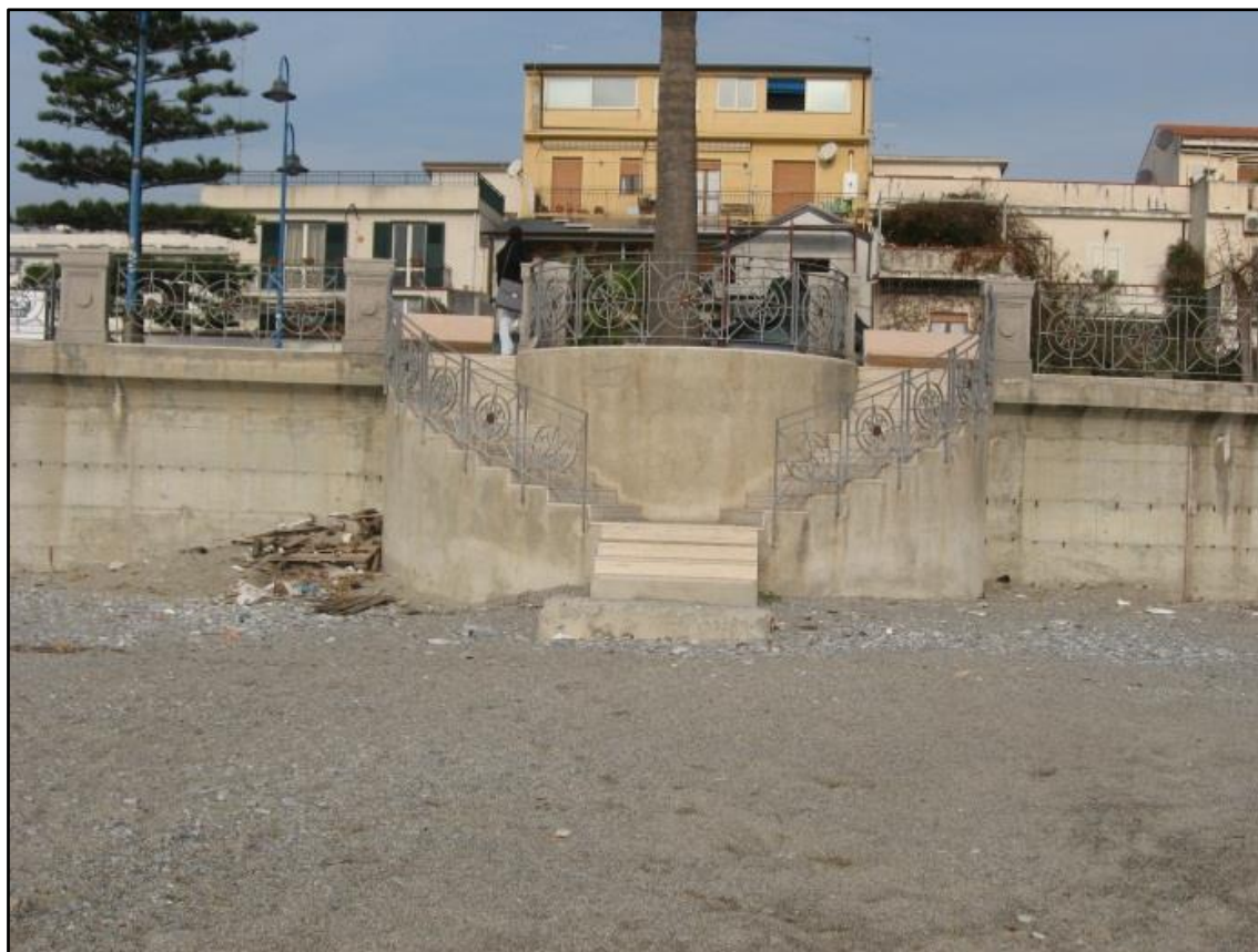
Figura 6: Accesso all'arenile dal lungomare C. Colombo