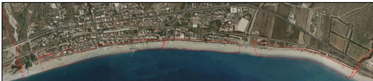
Figura 2: Individuazione dell'area di intervento

L'area oggetto di intervento è il Demanio Marittimo che si estende per una superficie pari a 225.603,00 mq.