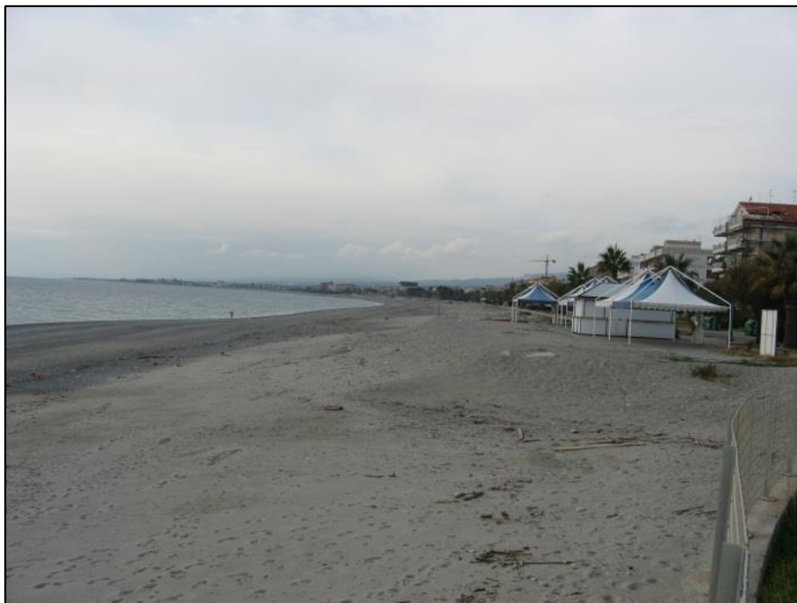
Figura 8: L'arenile a ridosso della ex SS106