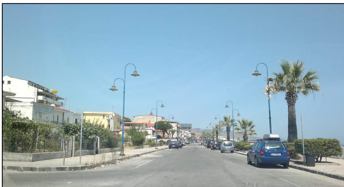
Figura 3: Veduta del lungomare C. Colombo

La seguente documentazione fotografica consiste essenzialmente in riprese effettuate a terra, ed ha lo scopo di dare una visione dello stato di fatto dei luoghi di intervento, nonché della qualità visiva del paesaggio.