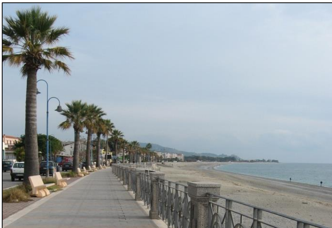
Figura 4: Veduta del lungomare C. Colombo