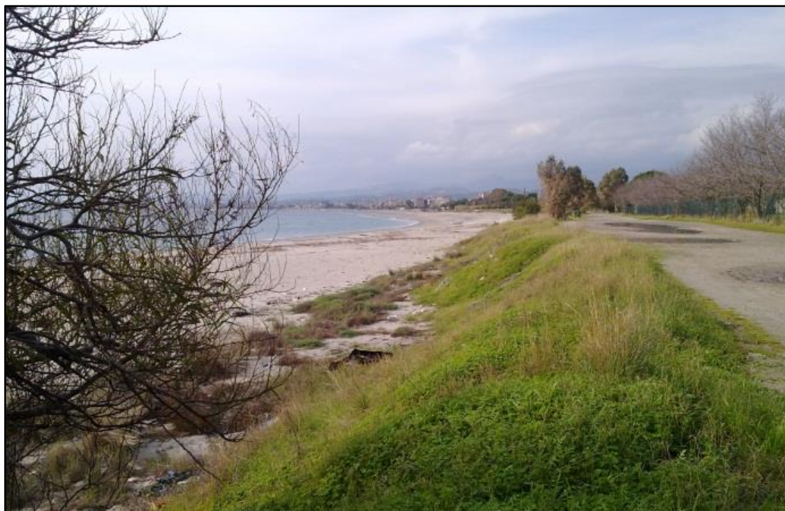
Figura 12: L'arenile a confine con Roccella Ionica

Dalla documentazione fotografica si evince che l'area oggetto di intervento è inserita in un contesto paesistico – ambientale che vede la coesistenza di aree urbanizzate con aree caratterizzate dalla presenza di fondi ed abitazioni agricole.